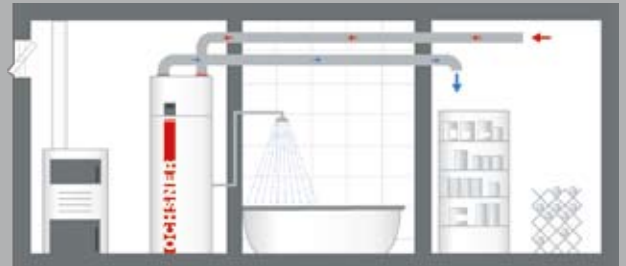
BEISPIEL A (Type Europa Mini IWP, 303 DK und 313 DK)