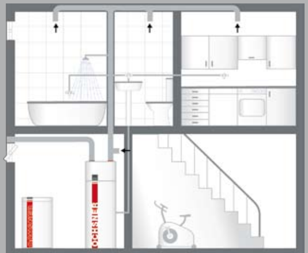
BEISPIEL C (Type Europa 313 DK)